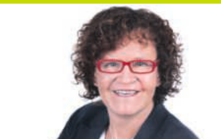
Kandidatenvorstellung zur BM-Wahl in Gaiberg