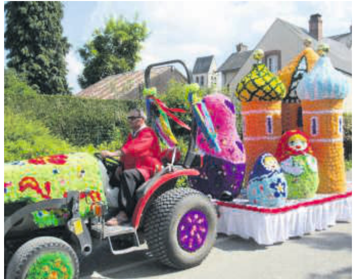
Mit bunten Wagen zogen die Umzugsteilnehmer durch die Straßen.

So verging die Zeit schnell bis zum Nachtmzug, bei dem die Wagen beleuchtet wurden, nochmals ein tolles Erlebnis. Anschließend ging der Tag mit einem fulminanten und mit Musik unterlegten Feuerwerk im Jardin de Wiesenbach