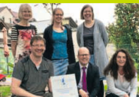
Auszeichnung für Kita