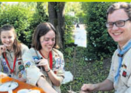
20 Jahre Pfadfinder