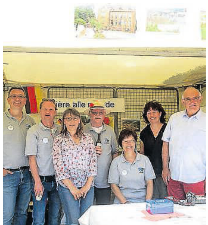
Alles leer! Der Freundeskreis war mit dem Getränkeverkauf sichtlich zufrieden.

Weitere Bilder des Wochenendes finden Sie auf der Homepage www.donnerywiesenbach.jimdo.com und im Schaukasten an der Hauptstraße vor dem Wiesenbacher Rathaus. Wer Interesse hat, im nächsten Jahr mit nach Donnery zu fahren, kann sich beim Freundeskreis melden.