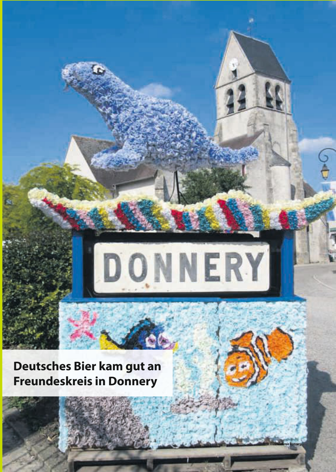
Deutsches Bier kam gut an Freundeskreis in Donnery